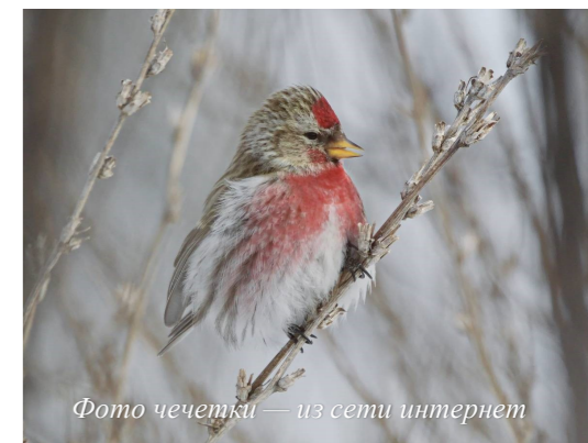
Фото чечетки