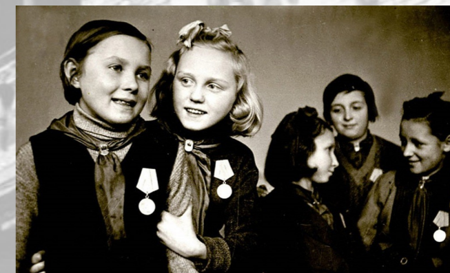
Отличницы 4 класса школы №47 г. Ленинграда, награжденные медалями «За оборону Ленинграда». Ноябрь 1943

Из школьных будней детей исчезло понятие шпаргалок, и никто уже давно не хулиганил — школьную дисциплину никто не нарушал. Весной учиться стало приятнее: иногда уроки проводились на свежем воздухе в скверах при школах. В конце мая — начале июня ребята сдавали экзамены. Даже война не смогла отвлечь их от серьезной подготовки. В июне в школах прошли блокадные выпускные вечера с праздничным обедом.