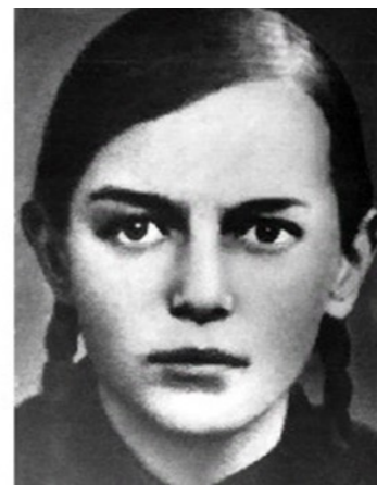
Саша Чекалин, Зина Портнова