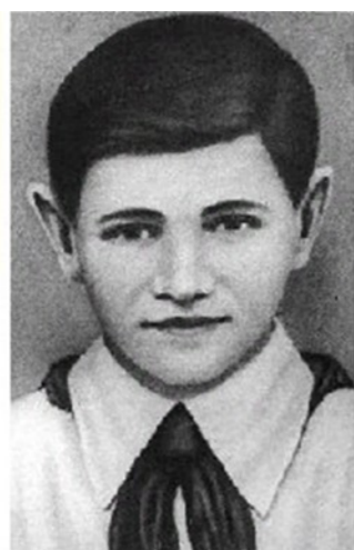
Марат Казей, Валя Котик

дали в плен, жертвуя собственными жизнями. Они сбегали из дома на фронт, чтобы защищать свою Родину.