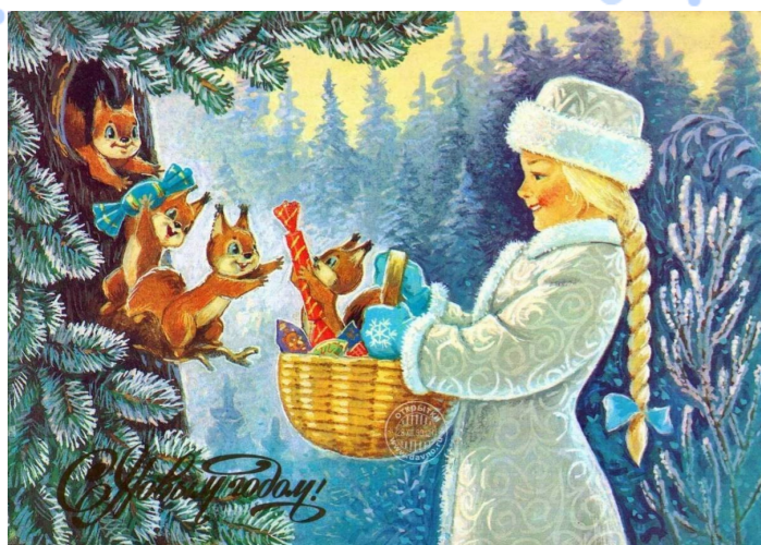
Советская новогодняя открытка, худ. Владимир Зарубин. 1980-е годы