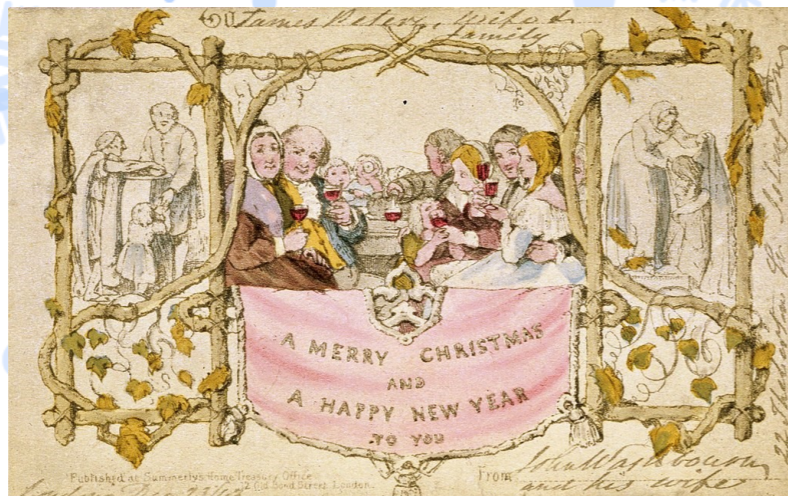
Первая в мире изданная промышленным способом рождественская открытка, рисунок которой был разработан Джоном Хорсли для Генри Коула

Не все приняли открытки сразу. Многие их критиковали. Во-первых, они очень дорого стоили; во-вторых, текст был открытым. Читать их могли посторонние люди. Коммерсанты все же подхватили идею, и открытки стали покупать состоятельные граждане. В начале 1870-х почтовые открытки быстро распространились по странам Европы.