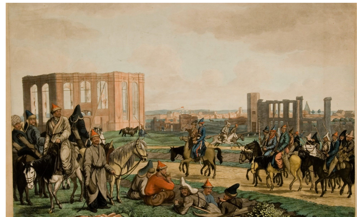
гравюра братьев Зур «Башкиры в разрушенных предместьях Гамбурга в 1814 году»